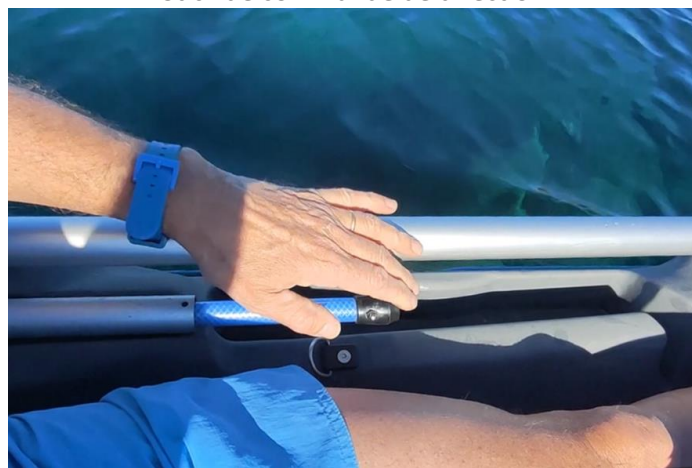
Stick de commande de direction