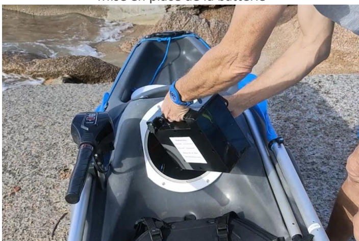
Mise en place de la batterie